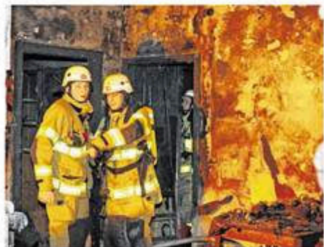
Obwohl die Aachener Feuerwehr den Brand schnell löschen konnte, ist die Erdgeschosswohnung in der Hansmannstraße durch die Flammen unbewohnbar geworden.