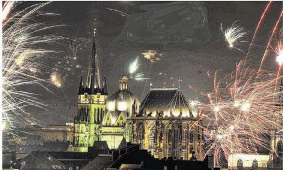
Mit vielen Böllern und Raketen haben die Aachener das neue Jahr 2015 begrüßt. Mit Ausnahme eines Brandes in Eilendorf bereits fünf Stunden vor Mitternacht blieb die Silvesternacht für Polizei und Feuerwehr aber verhältnismäßig ruhig.