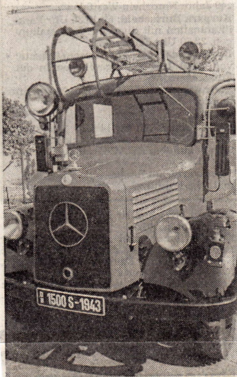
Mercedes-Benz Löschfahrzeug aus dem Jahr 1943. Auch dieser Wagen wurde wieder fahrtüchtig gemacht.